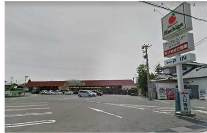
デリシアはちが店まで 450m