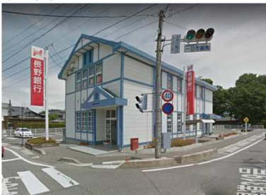
長野銀行三郷支店まで 350m