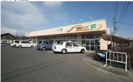
食彩スーパーFまで 430m