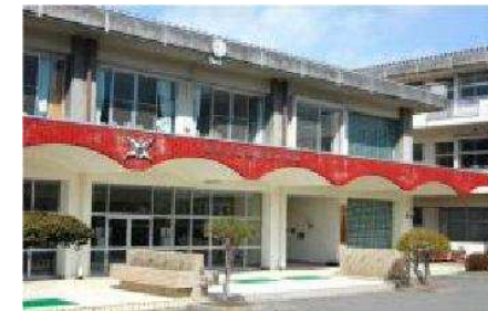
女鳥羽中学校まで 1,050m