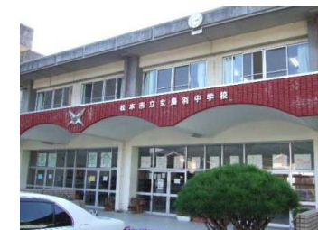
女鳥羽中学校まで 1050m