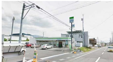
ファミリーマートまで 550m