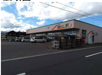
食彩スーパーまで 430m