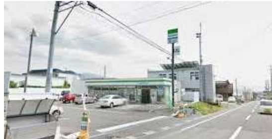
ファミリーマートまで 550m