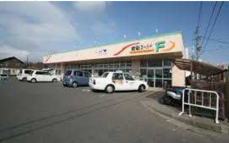
食彩スーパーFまで 430m