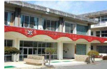
女鳥羽中学校まで 1,050m