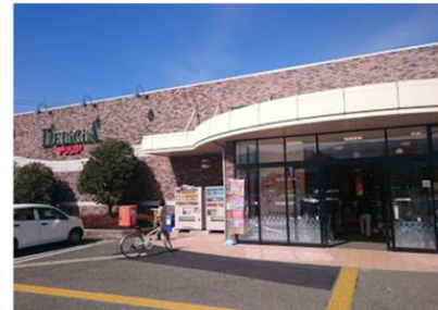
デリシア惣社店まで 1000m