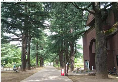
あがたの森公園まで 850m