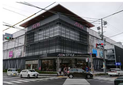
イオンモール松本まで 1400m